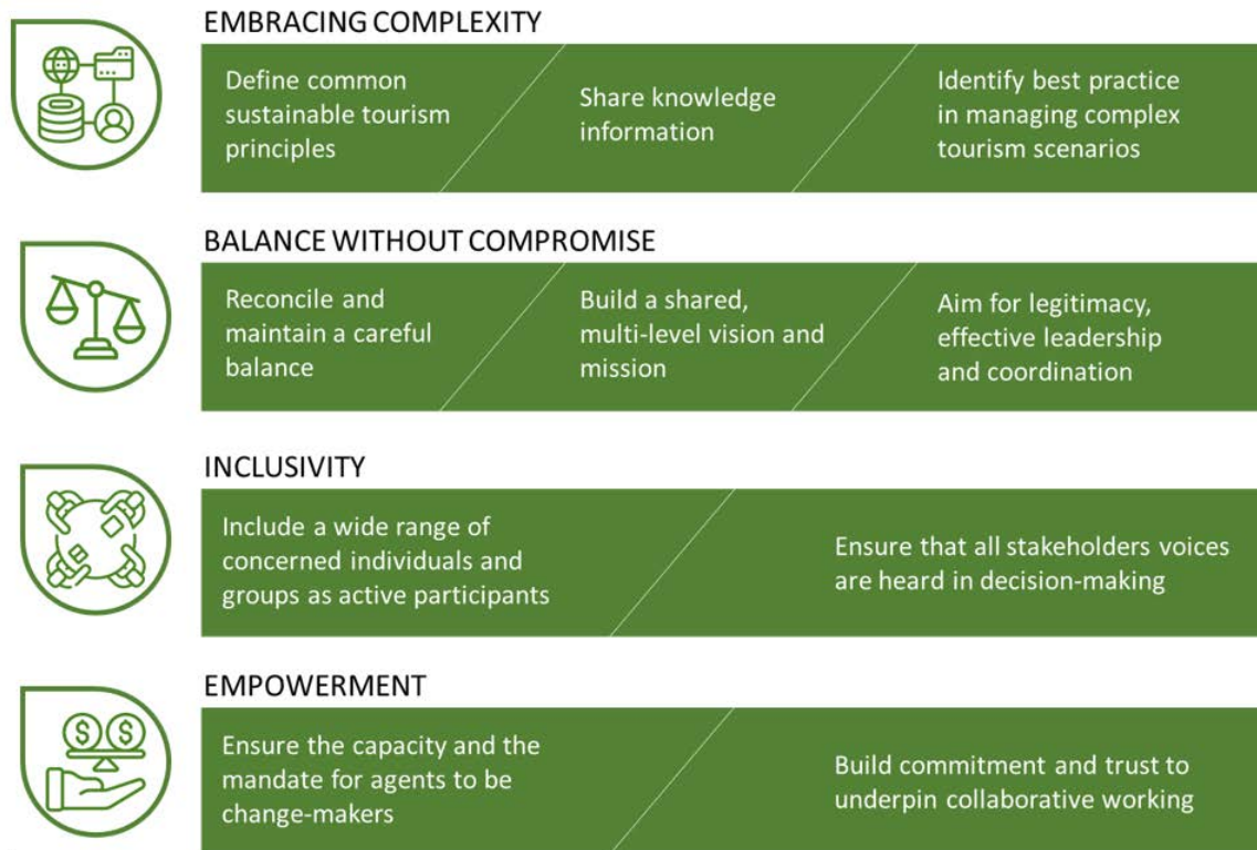
Slika 5 Načela učinkovitega upravljanja

Trajnostno upravljanje turizma mora doseči in vzdrževati natančno ravnovesje, ki bo usklajevalo okoljske, gospodarske in družbeno-kulturne razsežnosti trajnosti in krožnosti ter sprejeti usklajeno strateško načrtovanje in upravljanje turističnih dejavnosti in vplivov.