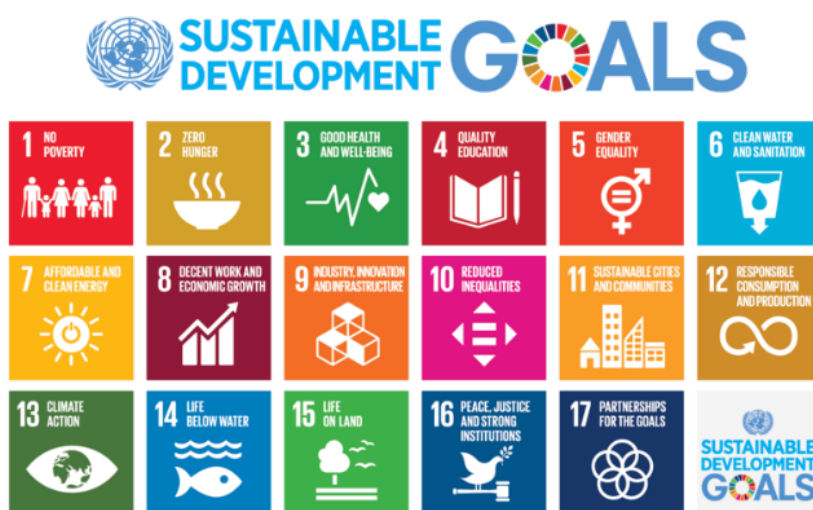
Slika 2: Cilji ZN za trajnostni razvoj

Zahteva se zlasti prispevek za turistični sektor za izpolnitev SDG št. 12, katerih cilj je zagotoviti trajnostne vzorce potrošnje in proizvodnje (angl. consumption and production patterns, v nadaljevanju: SCP).