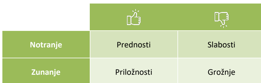
Slika 4: Shema analize SWOT